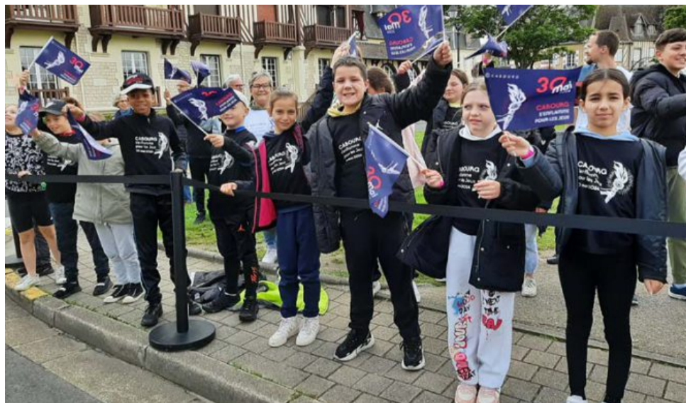
Près de 2 000 scolaires sont venus encourager les porteurs de la flamme.