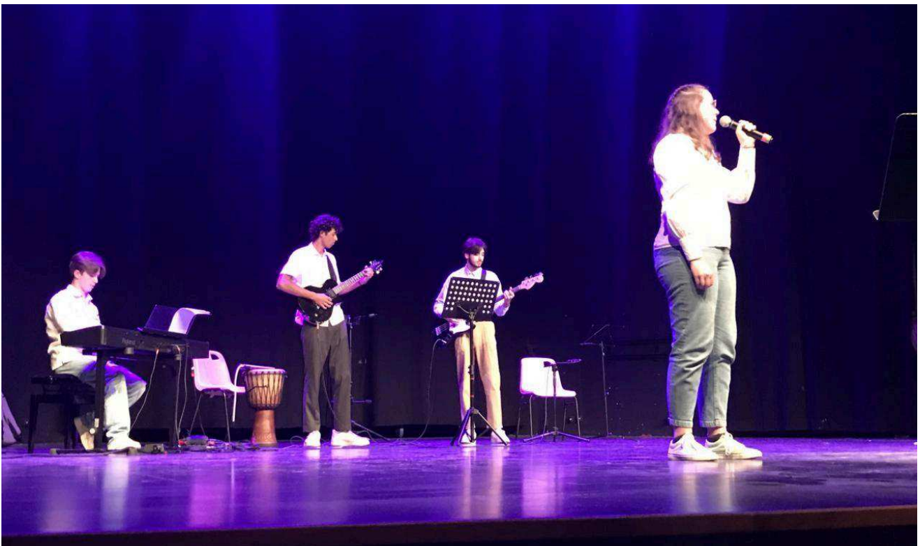
Les élèves de l'atelier musique ont ravi le public.