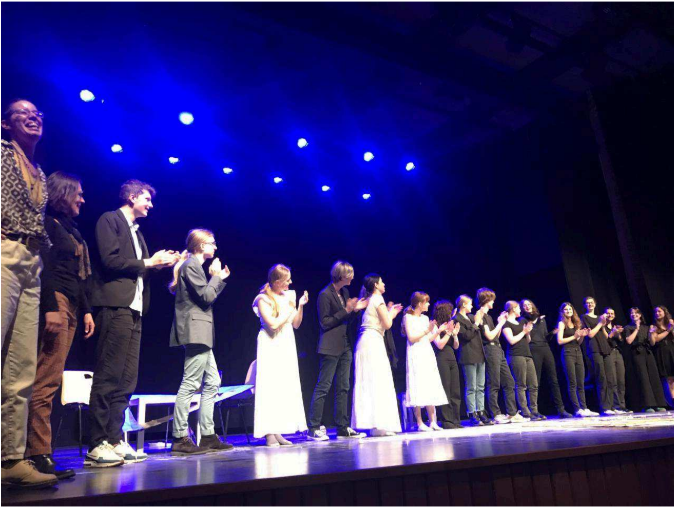
Les élèves de l'atelier théâtre et leurs professeurs.