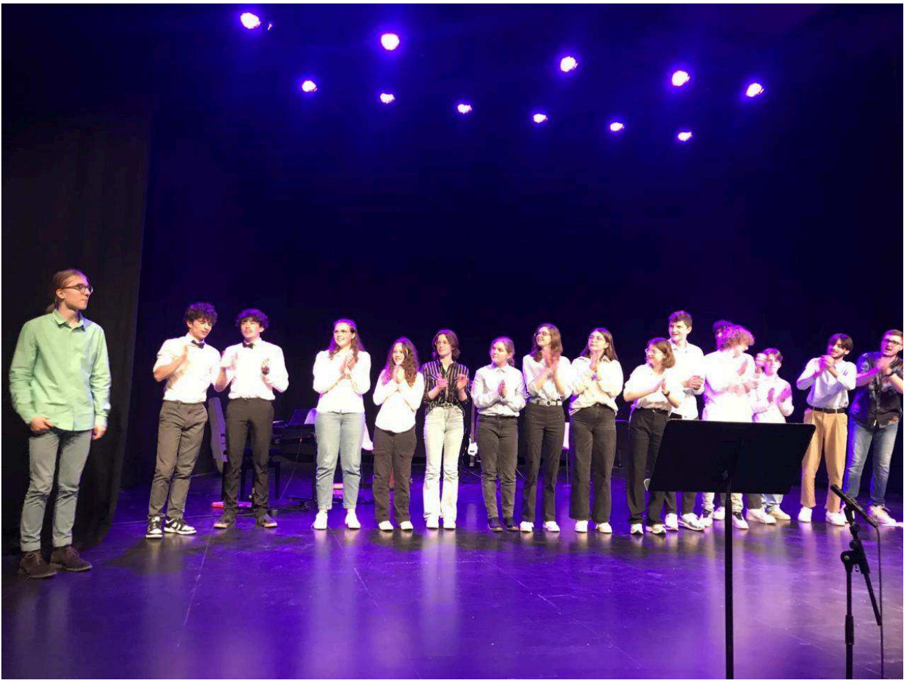
Les élèves de l'atelier musique.