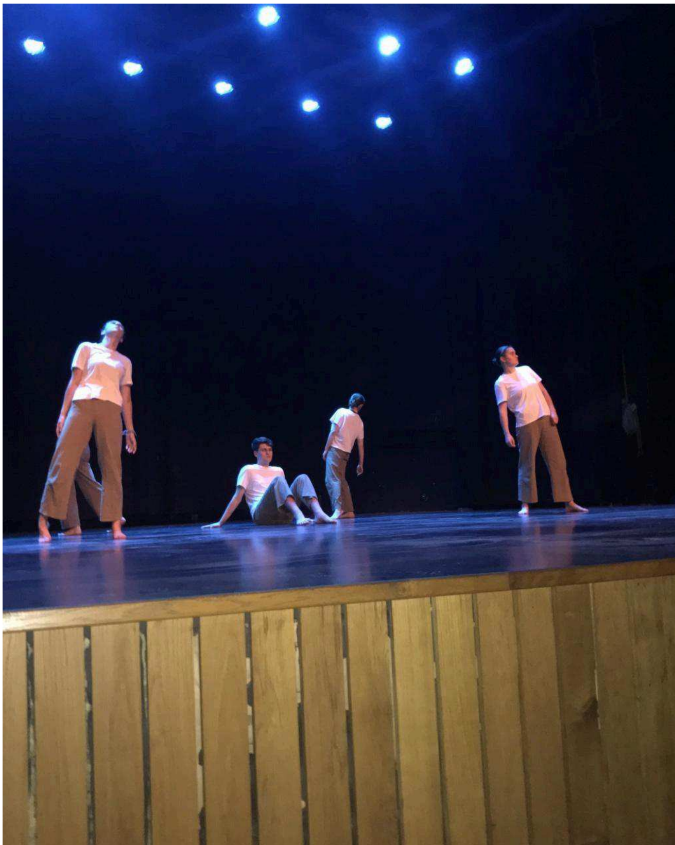
Un groupe d'élèves de terminale en danse.