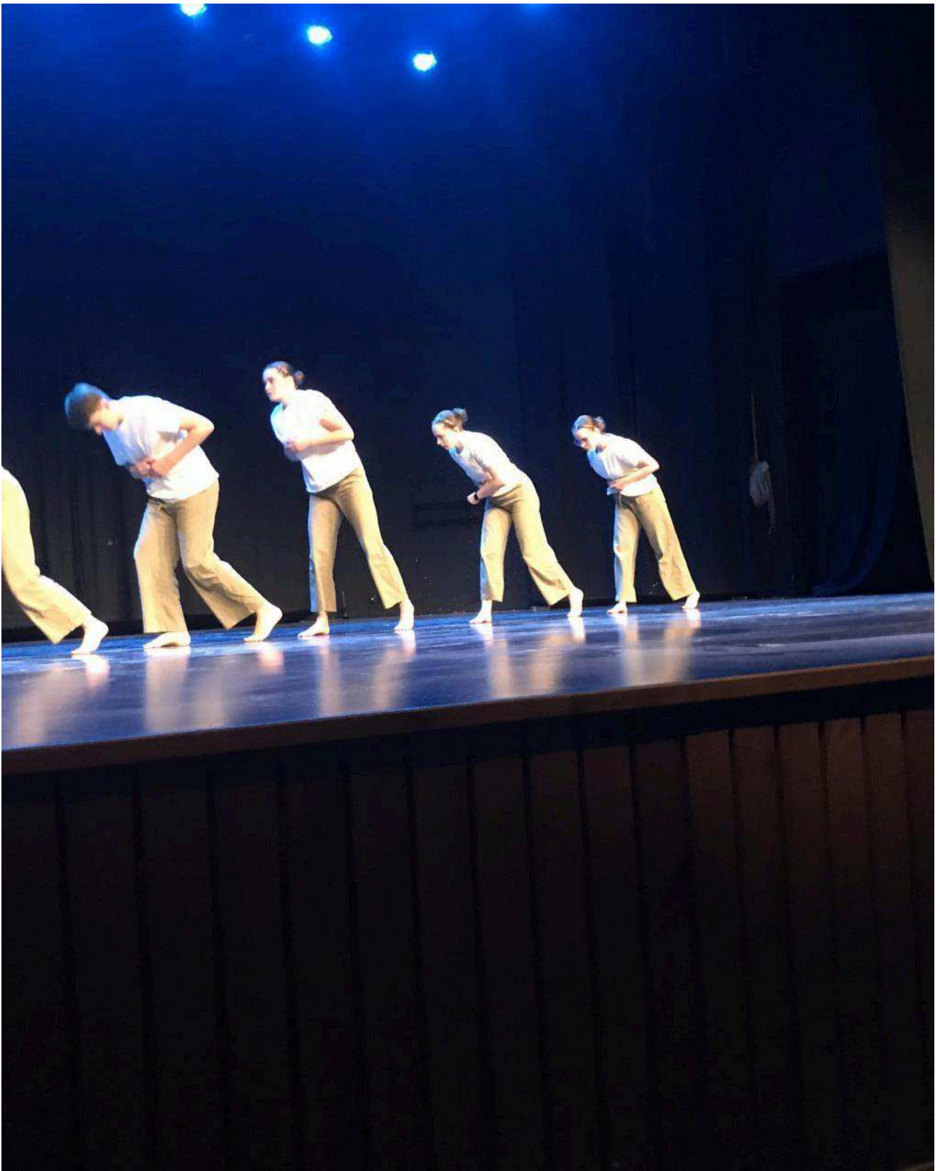
La danse d'un groupe d'élèves de terminale.