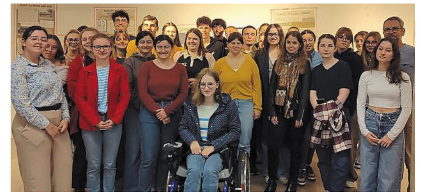
Une des classes de terminale du lycée Le Verrier qui a participé à l'élaboration de l'exposition.