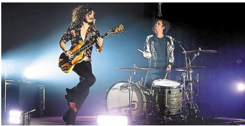
Le groupe Ko Ko Mo sera sur la scène du Normandy à Saint-Lô, le mercredi 4 décembre.