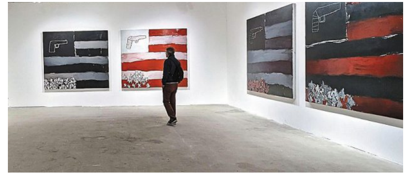
Une partie de la série « Ghost » du peintre américain Sean Scully.