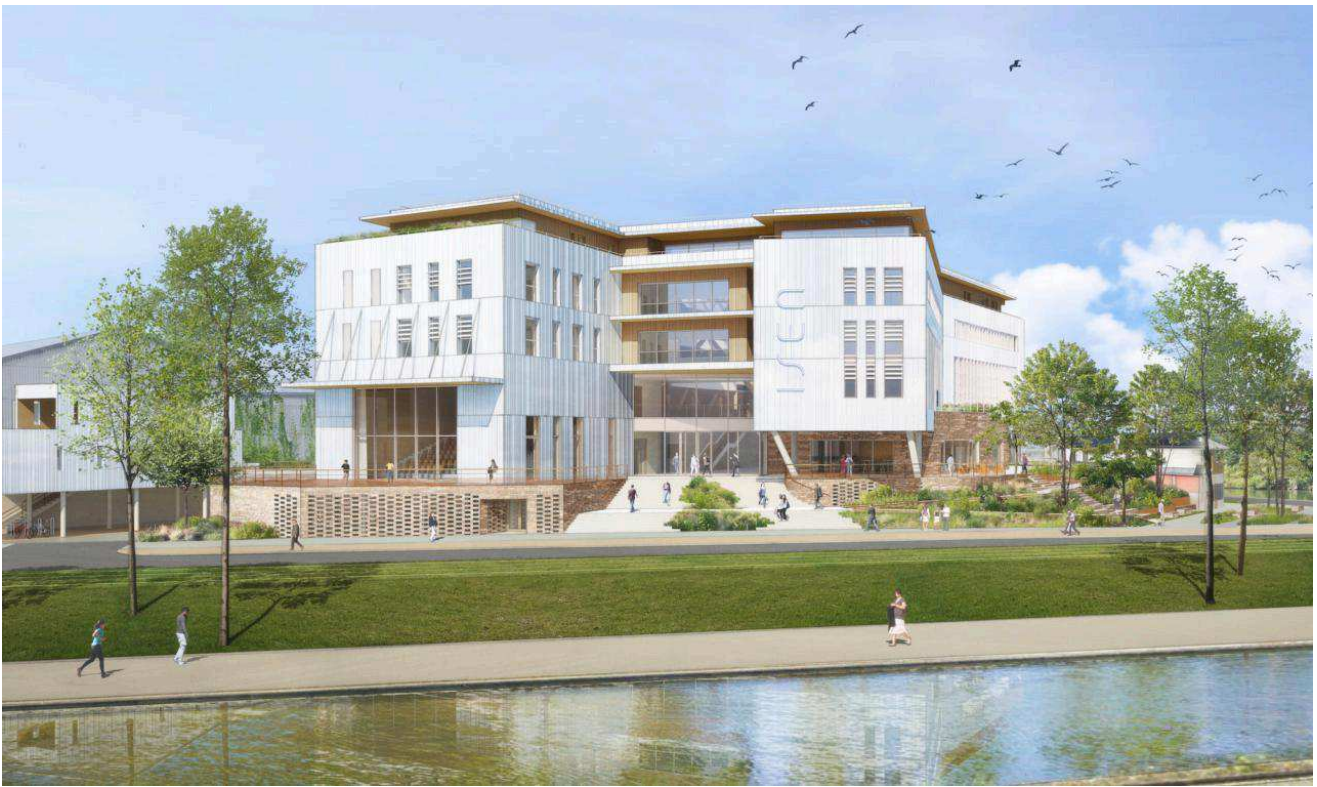
Situé à la pointe de la Presqu'île, le campus de l'école d'ingénieurs ISEN Ouest, a été pensé comme un navire. Epicuria Architectes