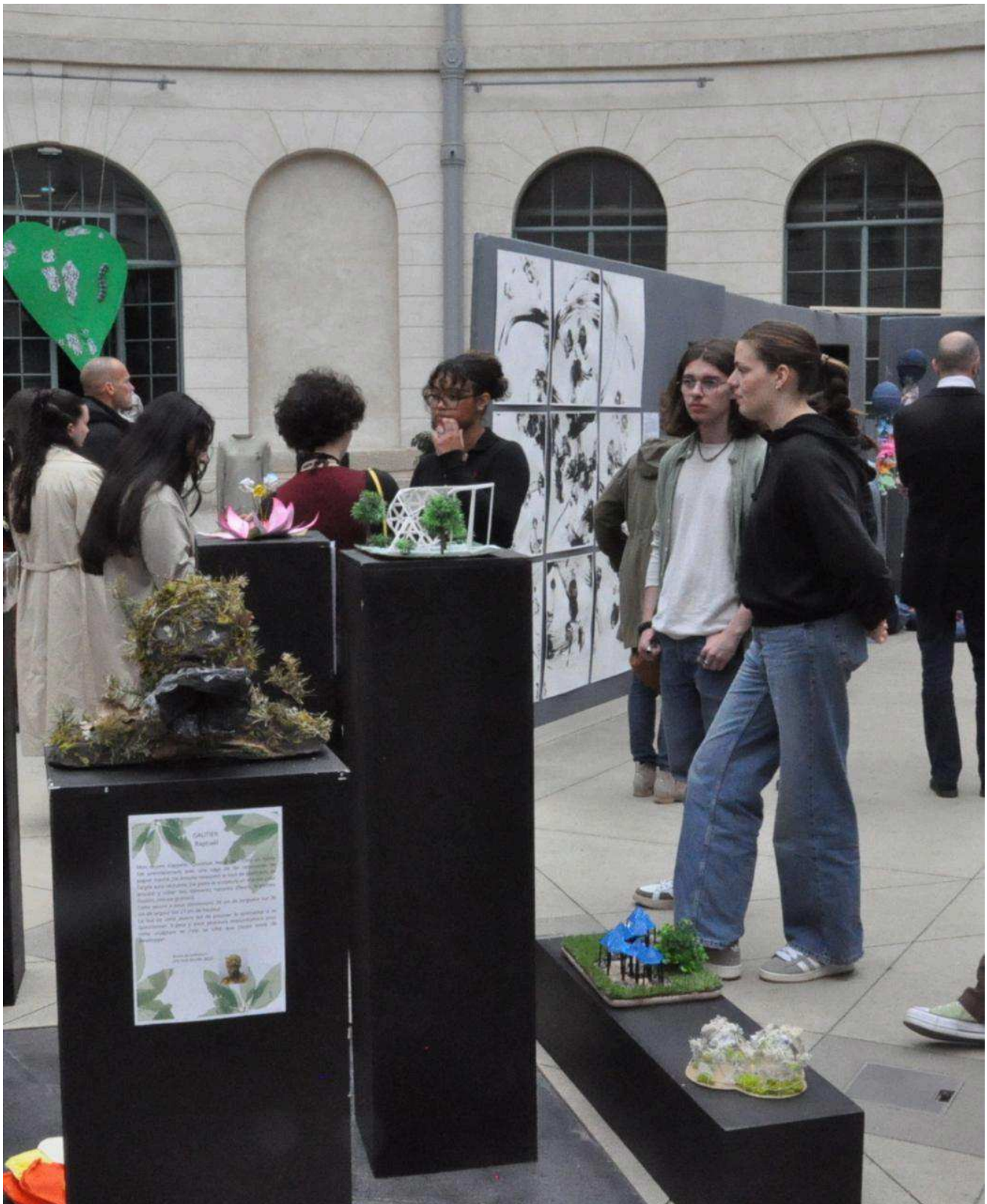
Le vernissage de l'exposition Jeunes pousses a eu lieu jeudi 16 mai à la Halle au blé.