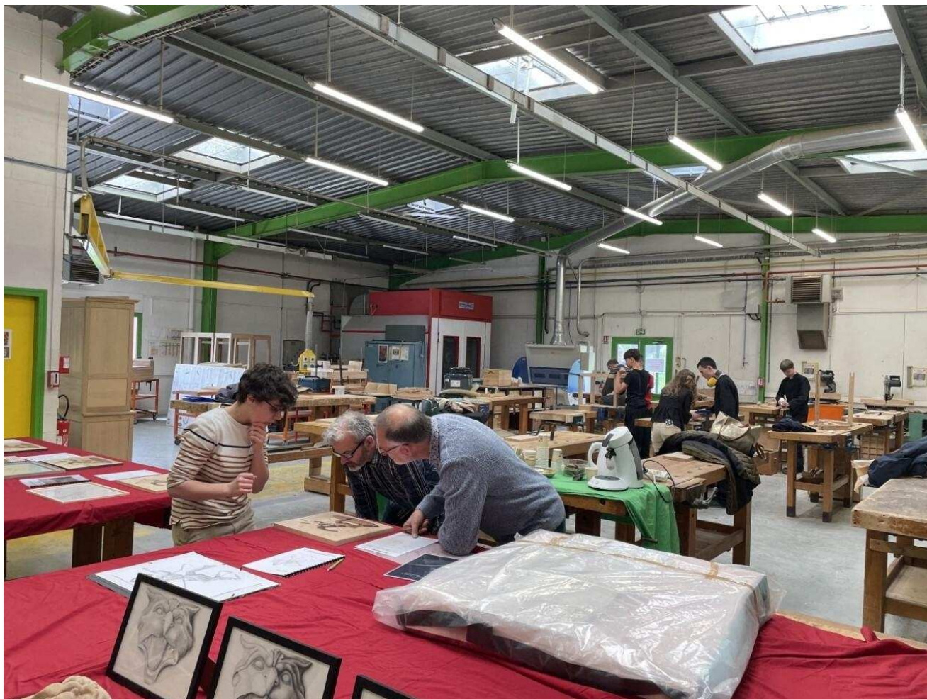
Trois pros notent et jugent les travaux en marqueterie