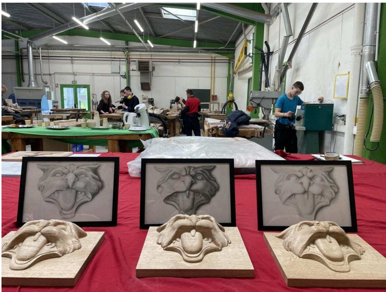
Les trois pièces de sculptures sur bois présentées au lycée Napoléon

Le concours « Un des meilleurs apprentis de France » s'est déroulé au niveau départemental et régional au lycée polyvalent Napoléon de L'Aigle .