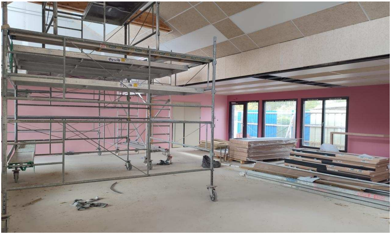
La salle de motricité en cours d'aménagement.