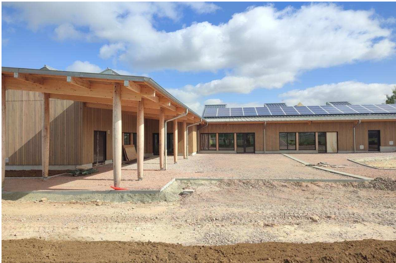
La cour de l'école va être recouverte de bitume. Des arbres y seront plantés. Liberté Caen

Concernant le centre de loisirs, l'UNCMT prendra à la rentrée les locaux provisoires actuellement occupés par les classes de maternelles.