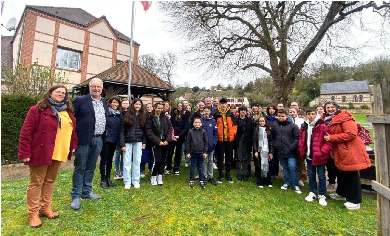
Photo souvenir du séjour en Normandie.

L'Espagne n'est pas en reste puisqu'un échange est prévu avec Valdepenas pour les élèves qui apprennent la langue, dans le cadre d'Erasmus + et des mobilités pour les professeurs, également avec d'autres pays d'Europe. L'accréditation du collège, valable jusqu'à 2027, offre la possibilité de réalisation d'autres projets.