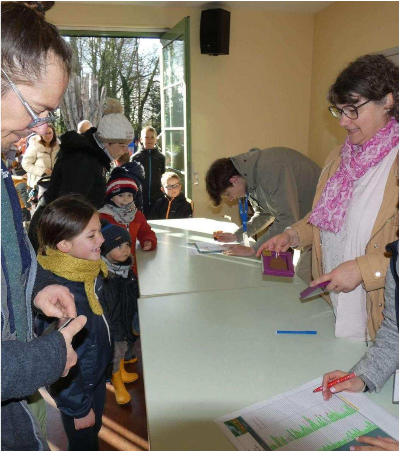
Une fois les défis remportés, les enfants ont reçu leur récompense. sa