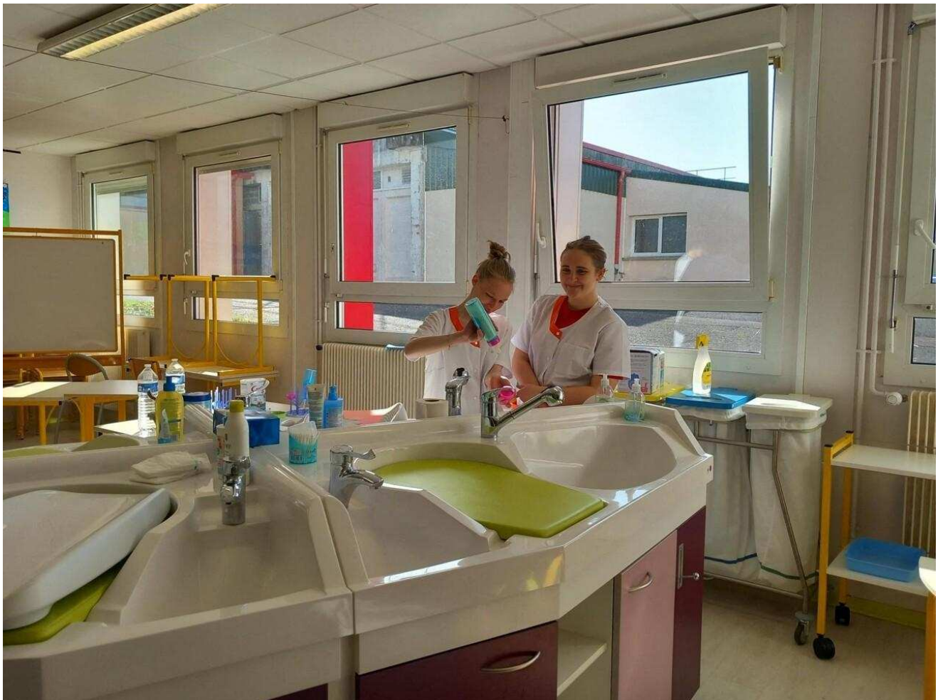
Des élèves en CAP de petite enfance, lors d'une mise en situation.

Que ce soit sur le site Liard ou Guibray, les familles, accueillies par les enseignants et les élèves, ont pu profiter de visiter les établissements et de s'informer sur les formations proposées. " Nous les emmenons dans les espaces qui correspondent à leur demande ", poursuit la proviseure adjointe. " Les élèves présents peuvent échanger sur leur formation."