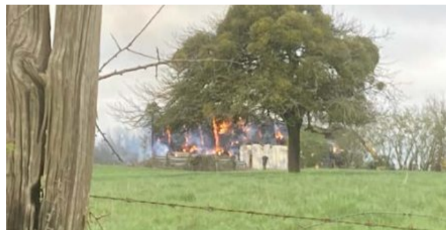
Le feu a pu être maîtrisé par les pompiers.

Dans la matinée du mercredi 27 mars 2024, un bâtiment agricole a pris feu au Pin-la-Garenne, sur la route de Mauves-sur-Huisne. Dans ce bâtiment de 800 m 2 situé dans l'impasse de la Piroutière, le feu a pris vers 7 h du matin dans une zone de stockage de foin et de paille de 200 m 2 .