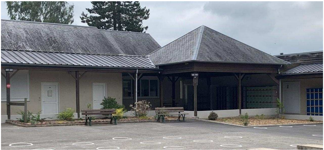
Des élèves de 3e veulent partir en voyage scolaire en Espagne. Photo d'archives.