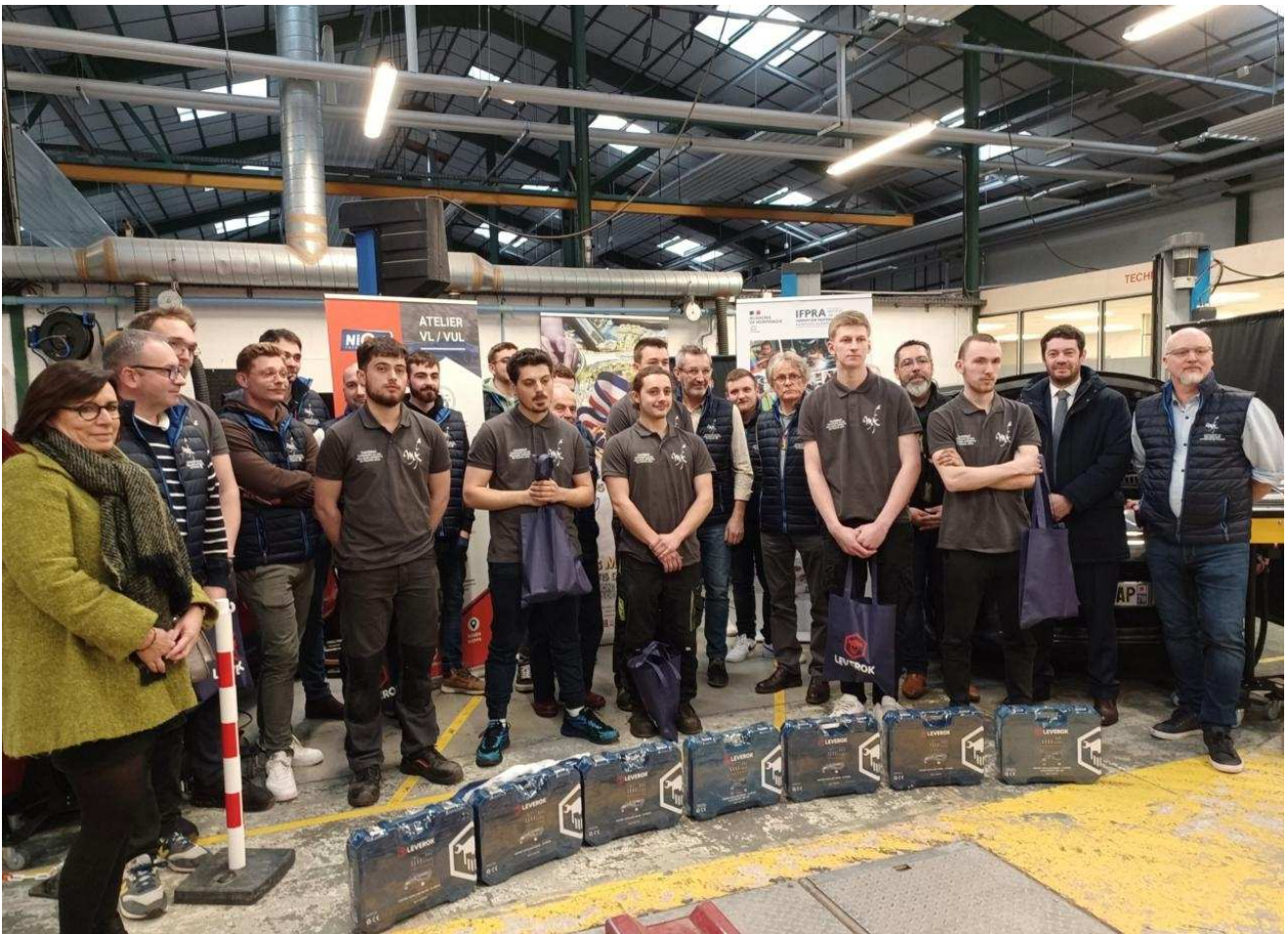
Les compétiteurs sont entourés des jurés, de leurs formateurs et de personnalités comme le maire de Pont-Audemer (2e à droite) J-F.T