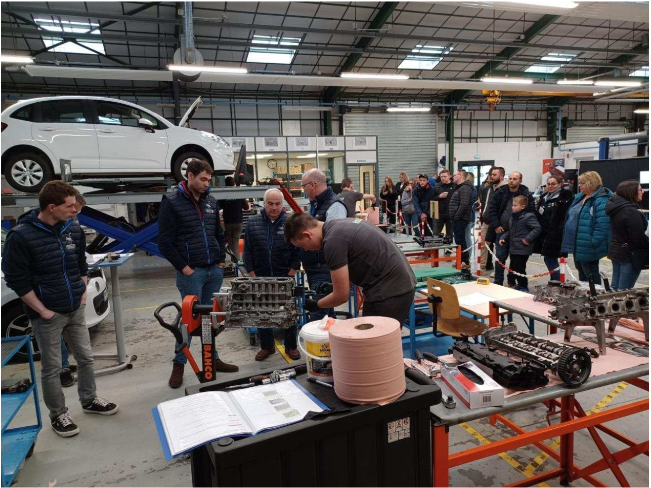
Le concours se déroulait sous le regard des jurés, mais aussi des familles venues soutenir les apprentis. J-F.T