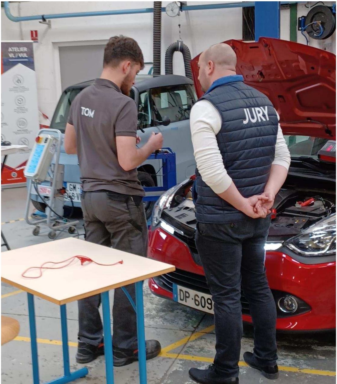
Chaque candidat devait réaliser huit épreuves de mécanique. J-F.T