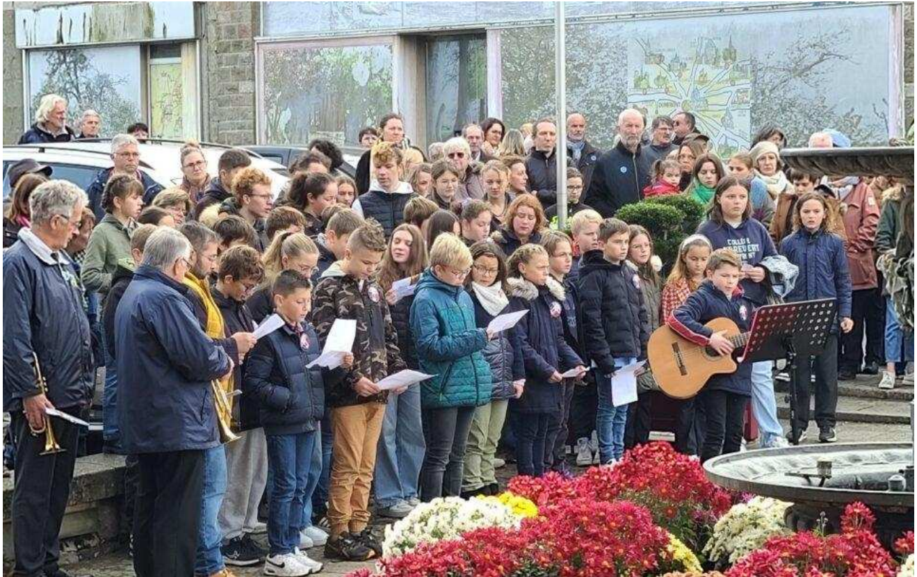
La classe de défense s'implique dans les cérémonies patriotiques de Domfront et dans le 80e anniversaire de la Libération.