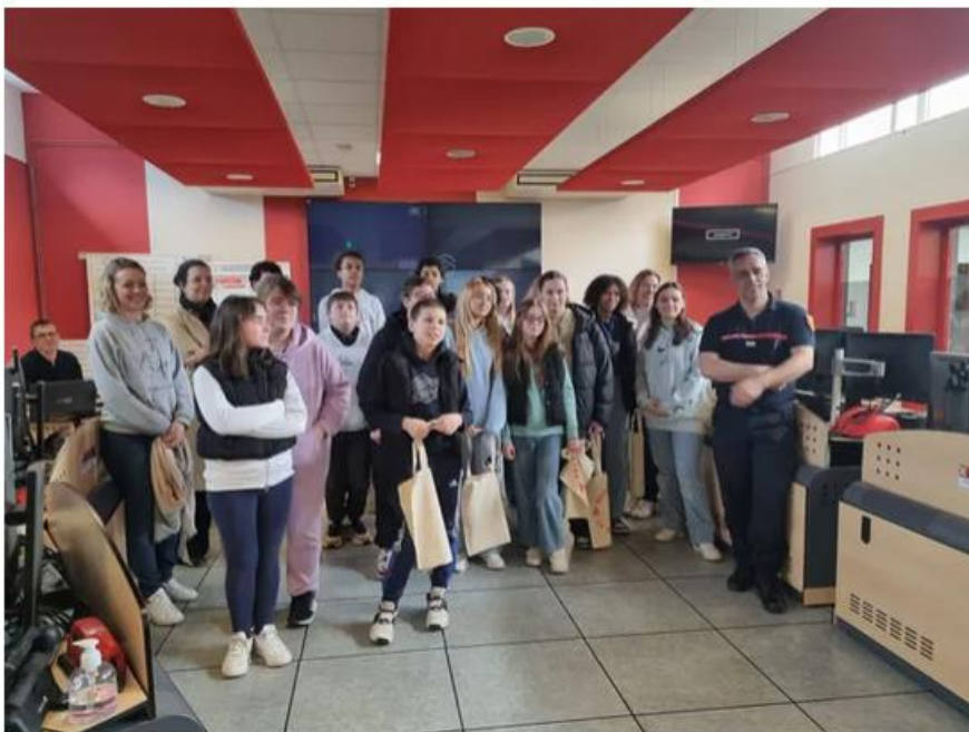
Parmi les élèves, certains souhaitent devenir pompiers plus tard ; tous estiment que c'est essentiel d'être formé aux premiers secours.