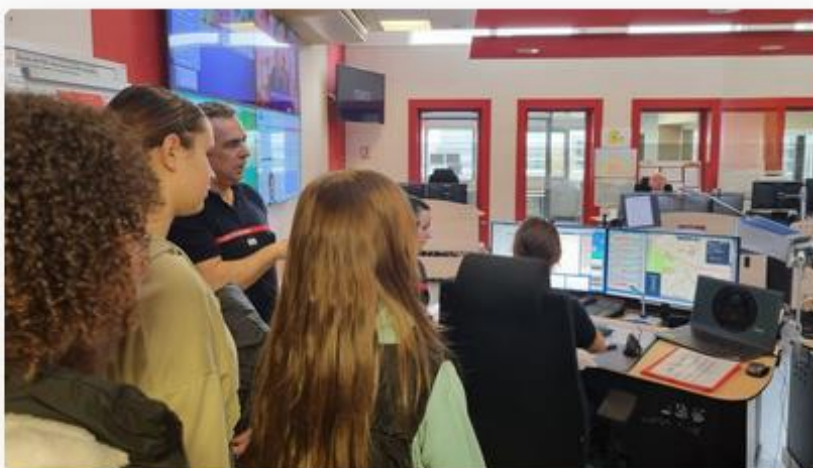
Les collégiennes et collégiens ont pu poser toutes leurs questions aux pompiers qui travaillent au Centre de traitement de l'alerte.

Ils veulent être prêts et connaître les bons réflexes à avoir, pour venir en aide aux personnes en cas d'urgence : 16 collégiens, en classes de quatrième et de troisième au collège Gisèle Guillemot de Mondeville, ont visité le Centre de traitement de l'alerte, au SDIS (Service départemental d'incendie et de secours) du Calvados, à la Folie-Couvrechef à Caen (Calvados) ce mercredi 28 février. L'occasion de voir comment travaillent les 28 opérateurs et 7 chefs de salle qui se relaient dans ce centre, pour réceptionner les appels d'urgence et les réorienter correctement ensuite.