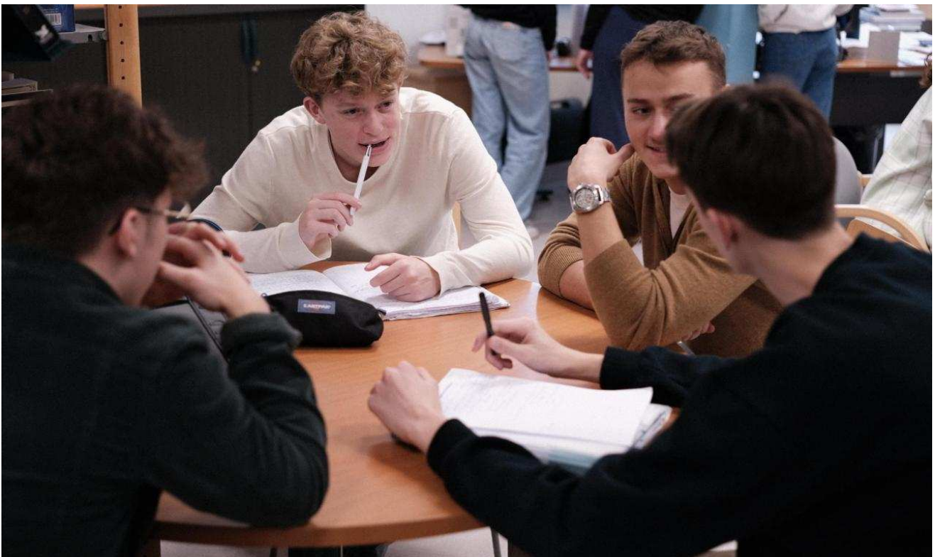
Par groupes, ils préparent une émission de radio et une exposition de photos.