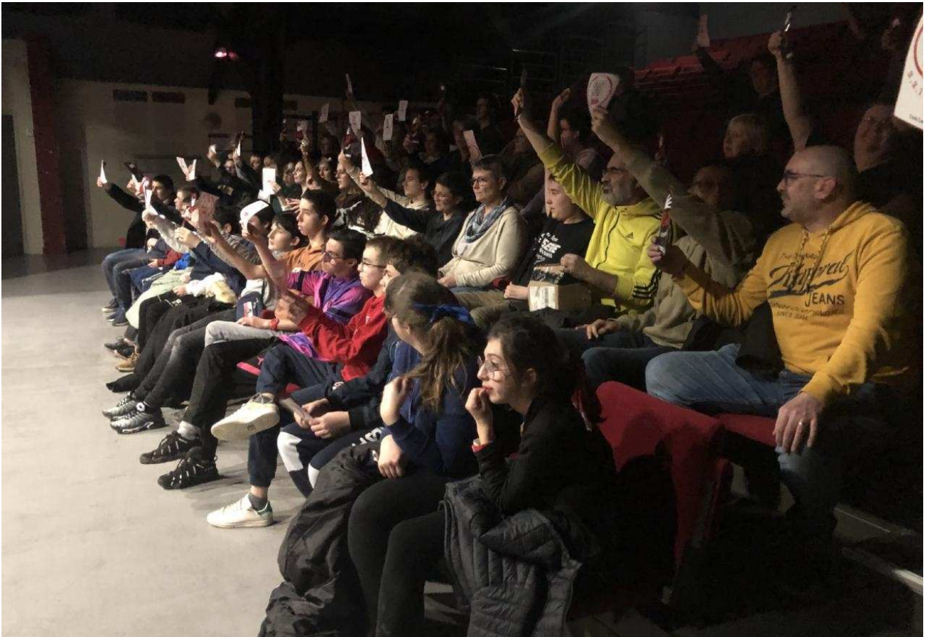
Le public présent lors de l'événement jugeait la performance des équipes.