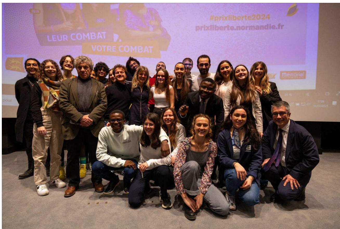
Le jury international du Prix Liberté.

Le jury a désigné trois personnalités engagées « dans un combat exemplaire en faveur de la liberté ». Les jeunes de 15 à 25 ans pourront voter en ligne du 20 mars au 30 avril 2024.