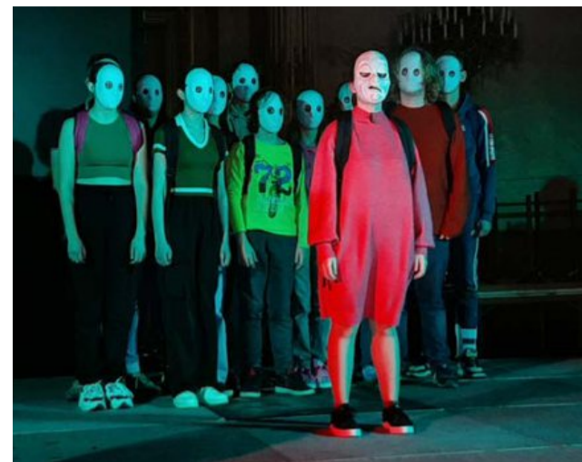
Au fil des jours, les jeunes harcelés sont exclus du groupe. Ils se referment sur eux et pour certains, c'est « la descente aux enfers », « des idées de suicide ». Un mal-être illustré, au premier plan sur scène, par un masque où le visage est déformé. En arrière-plan, des masques figés pour représenter ceux qui savaient et qui n'ont pas dénoncé.