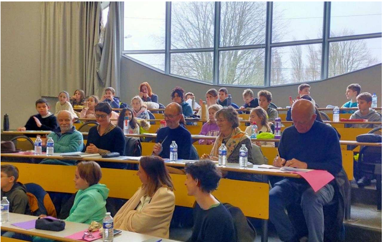
Professeurs, bénévoles de la bibliothèque, président d'Agora, conseillère pédagogique...