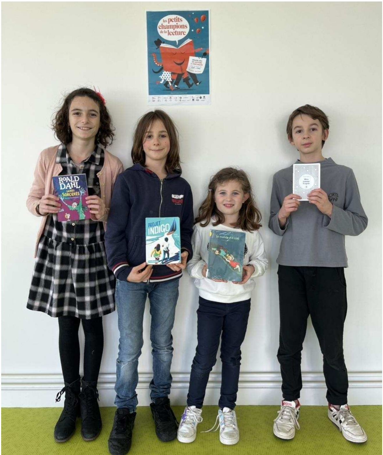
Des enfants lecteurs de l'École Publique de Bellême