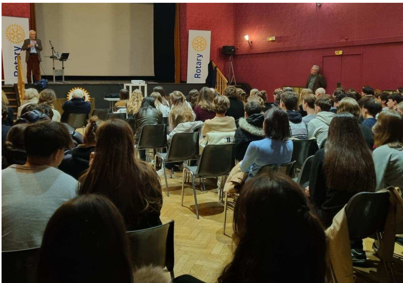
Enjeux et risques de l'IA étaient au menu de la conférence proposée aux lycéens.