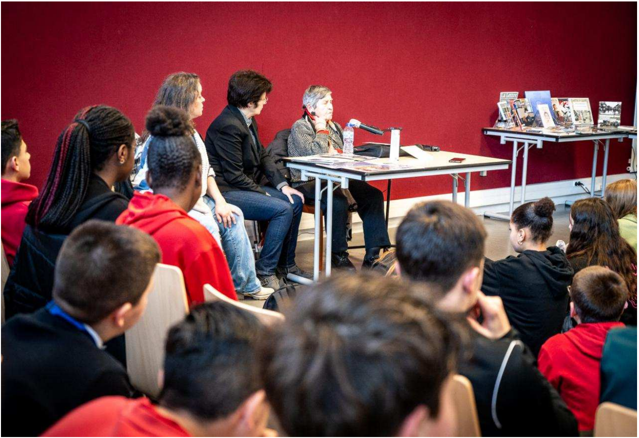
Un travail interdisciplinaire de quatre classes de troisième prolongé par une exposition. J.H.