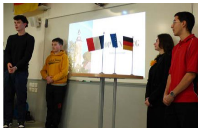
Les élèves du lycée Fresnel qui ont présenté la réunion et commenté leur voyage à Cloppenburg.

Même satisfaction chez les quatre lycéens de Fresnel revenant d'un séjour à Cloppenburg. Autant de commentaires exprimés en toute