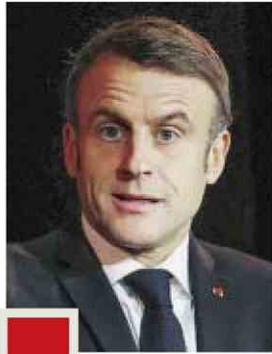
MOHAMMED BADRA / AFP

Sur les 10 métiers les plus recherchés par les employeurs, 100 % sont des diplômes de l'enseignement professionnel