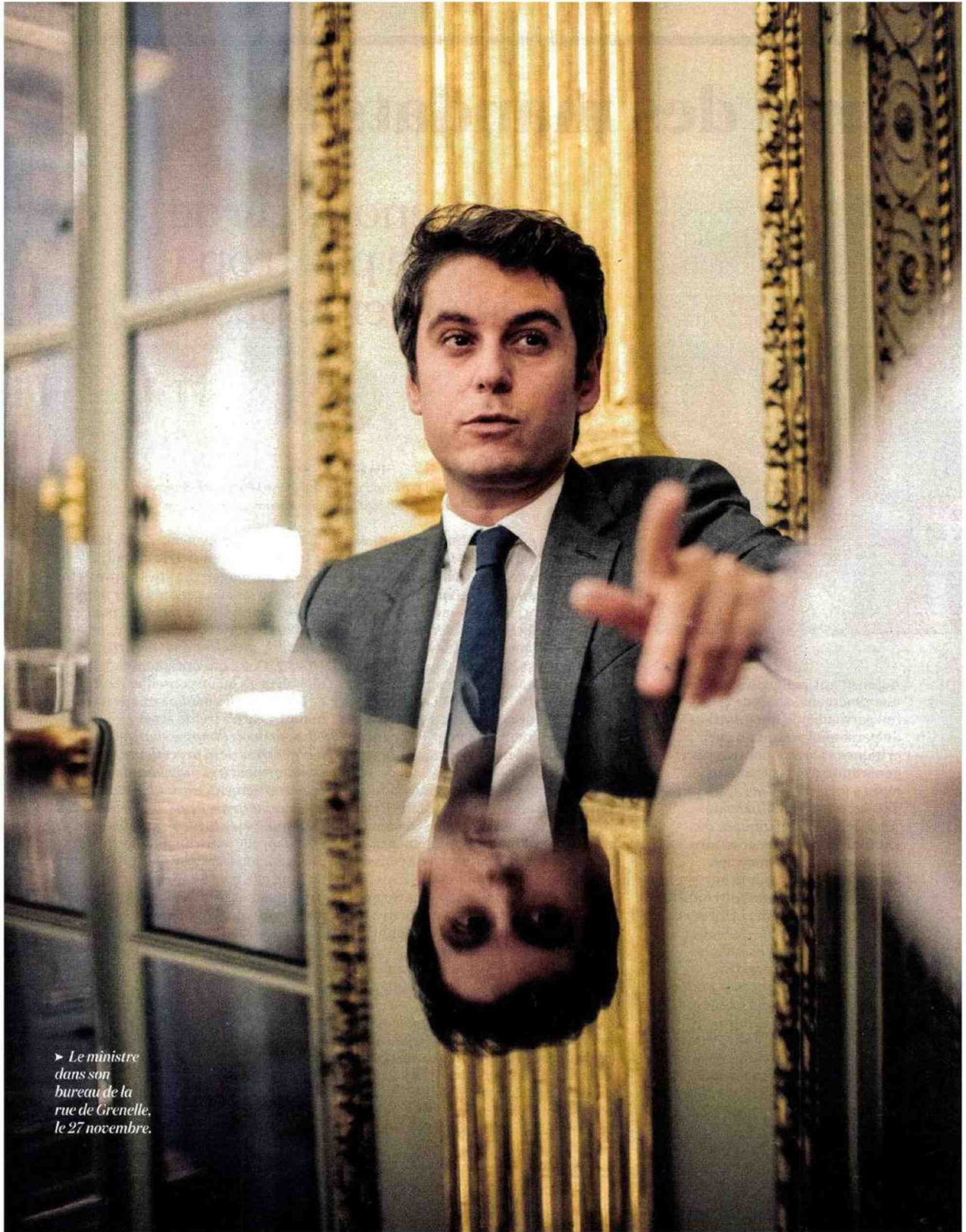
► Le ministre dans son bureau de la rue de Grenelle, le 27 novembre.