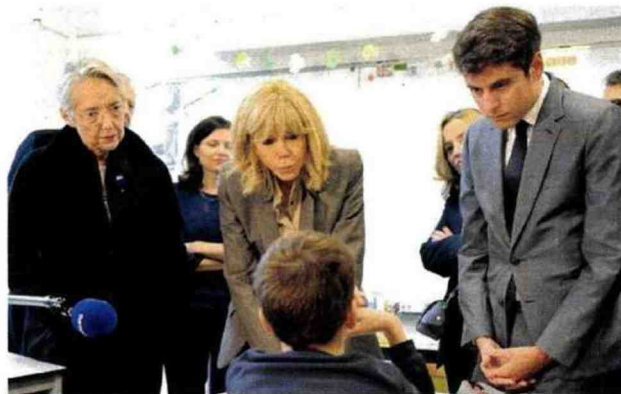
▼ Elisabeth Borne, Brigitte Macron et Gabriel Attal en visite dans un collège parisien à l’occasion de la journée de lutte contre le harcèlement scolaire, le 9 novembre.

Un terme apparaît peu dans votre discours : celui d’inégalité. Pourtant, la spécificité du système