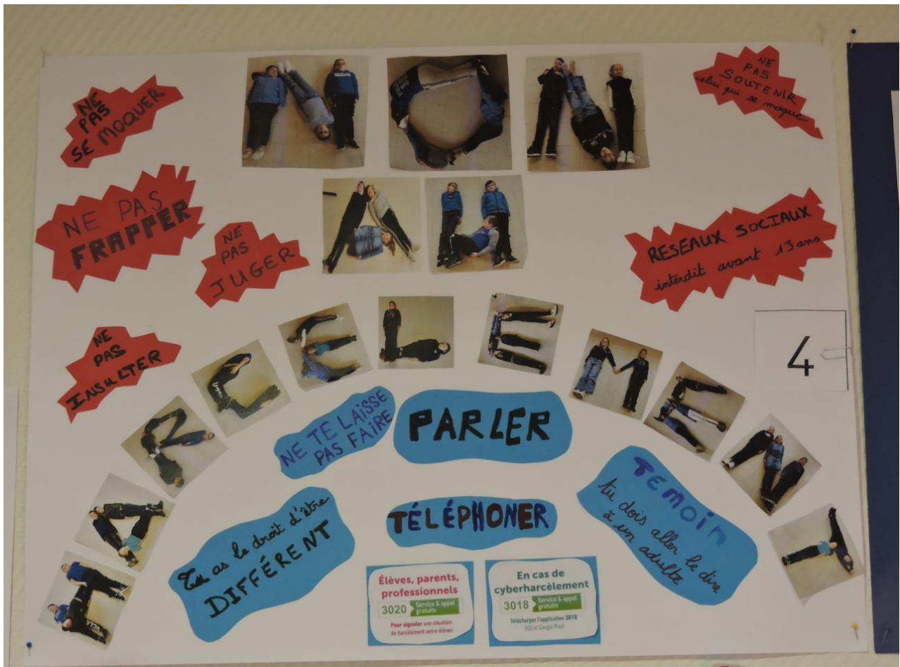
Les élèves en action.