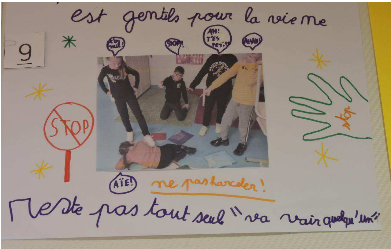
L'affiche des CE2 est la grande gagnante.