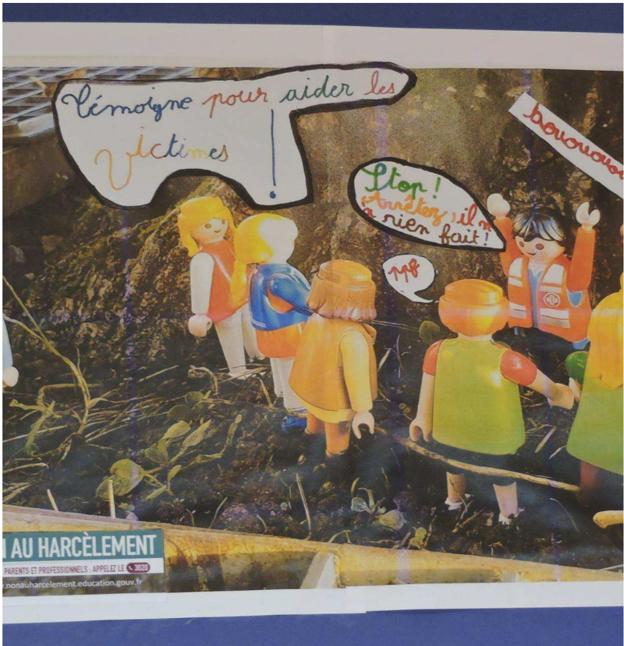
Les Playmobil en action