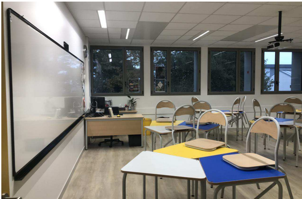
Les salles de classes de 55 m2 ont été rénovées.