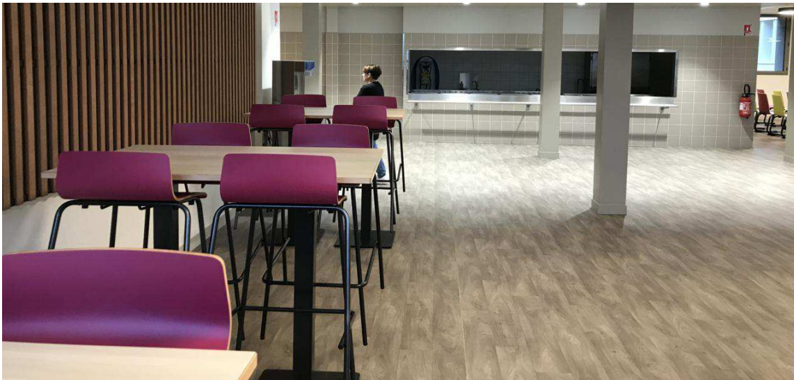
Le réfectoire du collège Jean-Monnet a été refait entièrement.