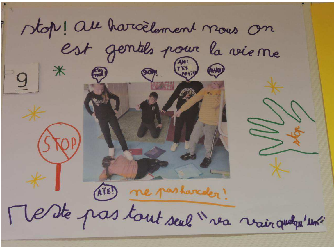
L'affiche des CE2 est la grande gagnante.