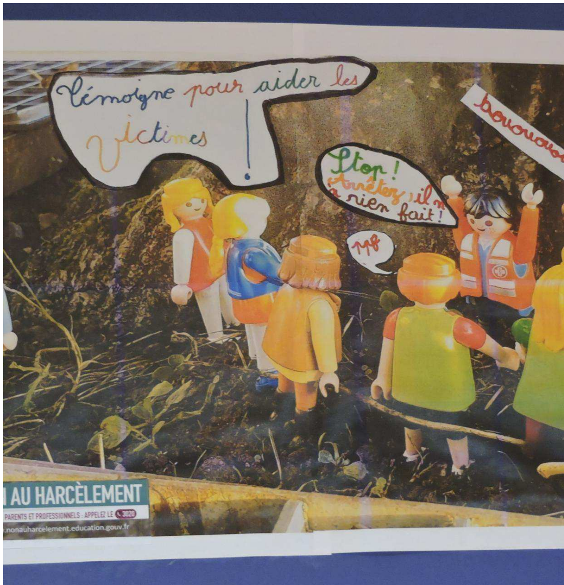
Les Playmobil en action