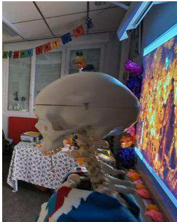
Une salle colorée