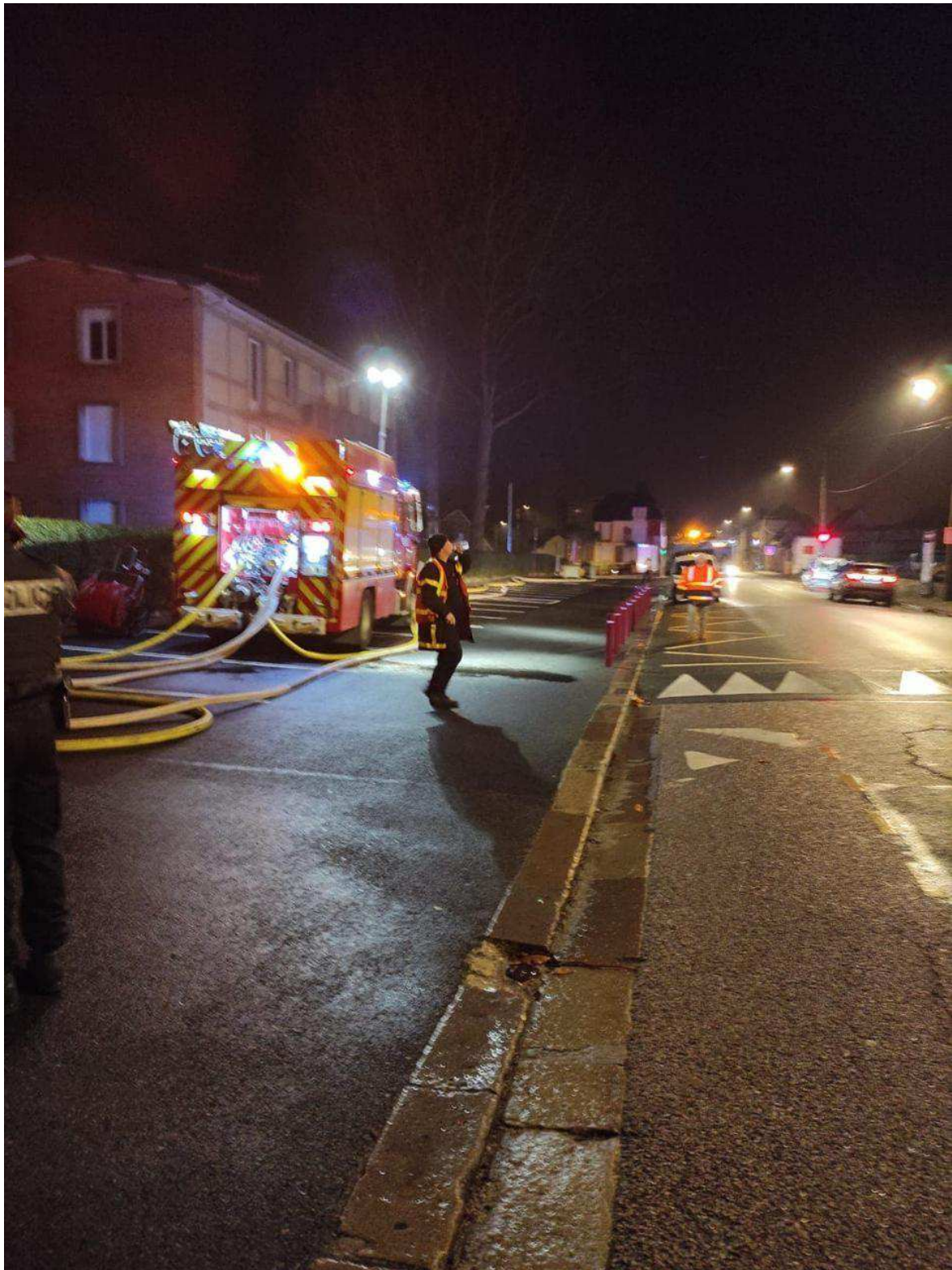
Cinquante-cinq pompiers ont été mobilisés, ce lundi 27 novembre 2023.