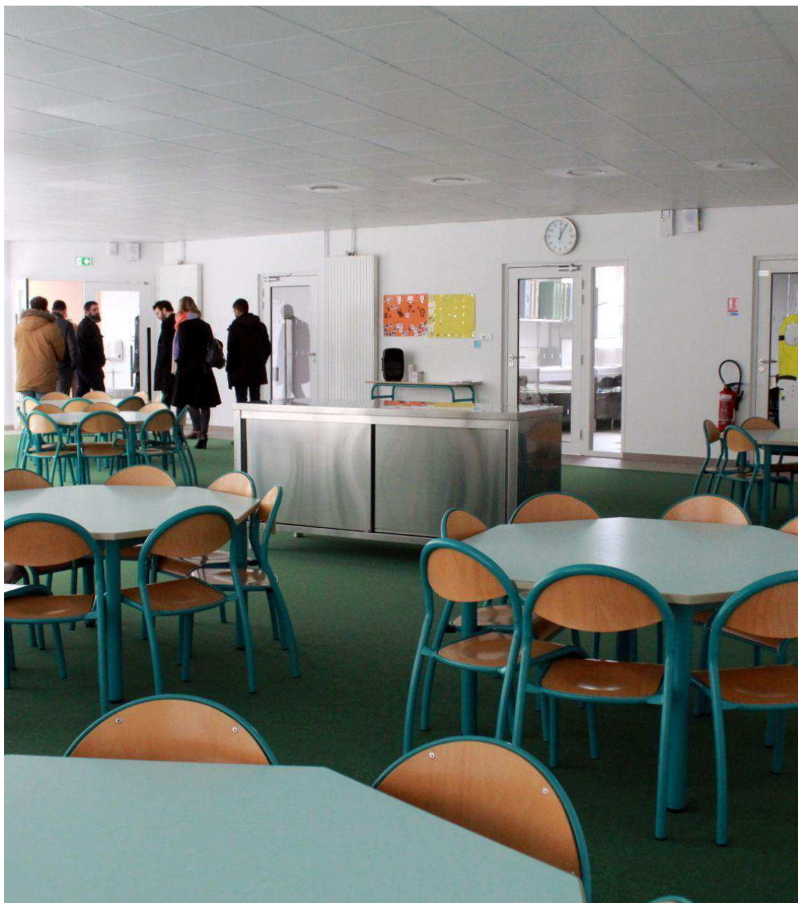
Les deux restaurants scolaires sont neufs et plus grands (ici, à l'école Paul Fort) Liberté