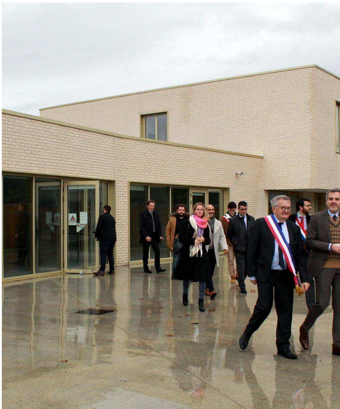
L'inauguration des écoles requalifiées s'est faite en présence de Stéphane Bredin, préfet du Calvados (à droite), et d'Arthur Delaporte, député (à l'arrière-plan à droite), ici avec le maire et les élus locaux devant les nouveaux locaux associatifs Liberté