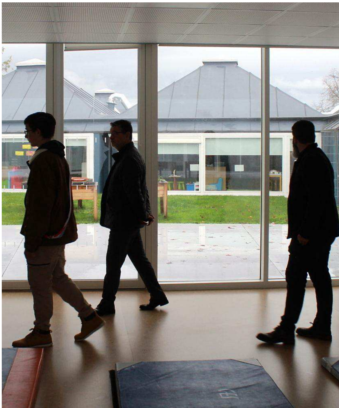
Les nombreuses baies vitrées de l'école Paul Fort Liberté