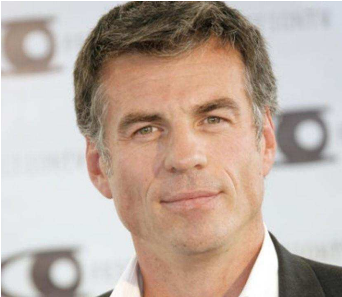
Bruno Gaccio, plume des Guignols, sera présent.