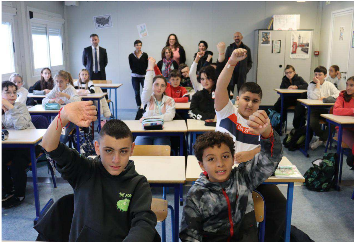
Pour la journée de lutte nationale, les élèves du collège Molière portaient tous un bracelet rouge autour de leur poignée