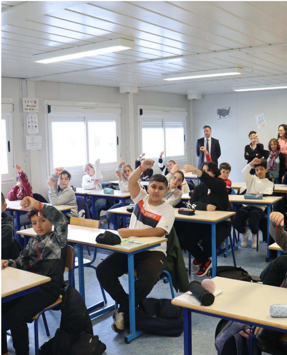
Les élèves du collège Molière portaient tous un bracelet rouge, jeudi 9 novembre, signe de lutte contre le harcèlement scolaire