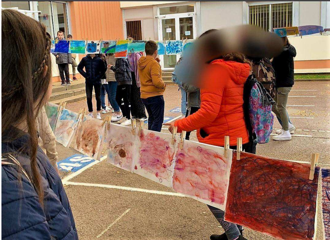
Exposition éphémère entre deux averses C.J.V

Comment 'étonner alors de cette déclaration: "pour moi c'est certain .. je continuerai l'an prochain !" ?