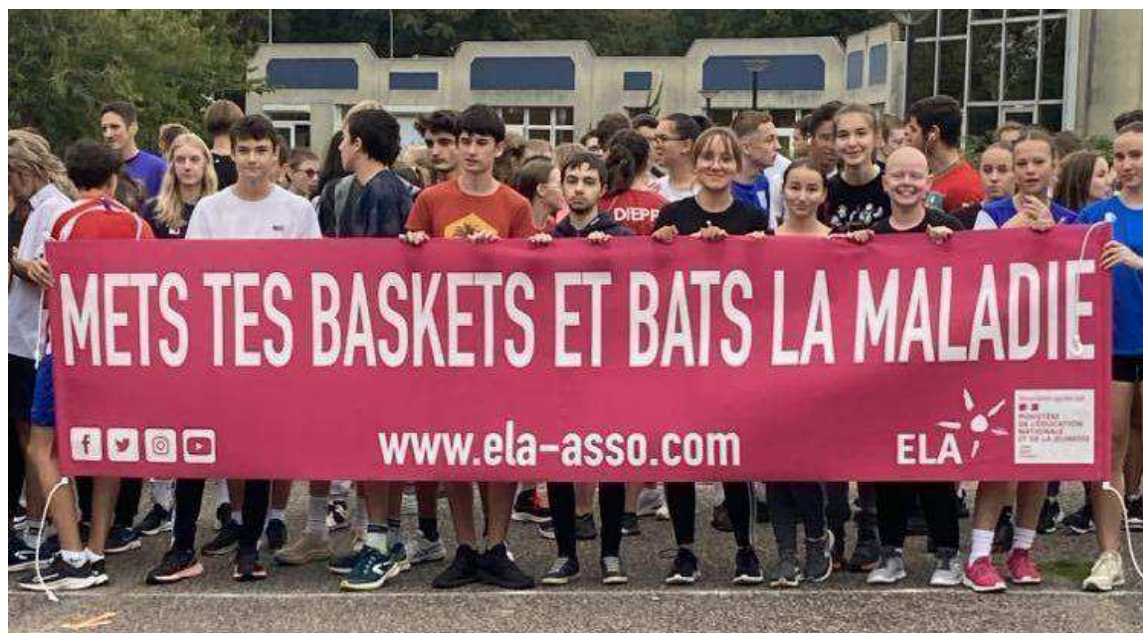
Une marche solidaire au profit de l'association Ela a été organisée.

Les récompenses aux coureurs et aux participants déguisés ont ensuite été remises en musique avec le concert du club de musique. Les prochains rendez-vous sportifs sont déjà fixés pour les lycéens de Pablo-Neruda, dont le cross départemental UNSS au Havre mercredi 29 novembre.