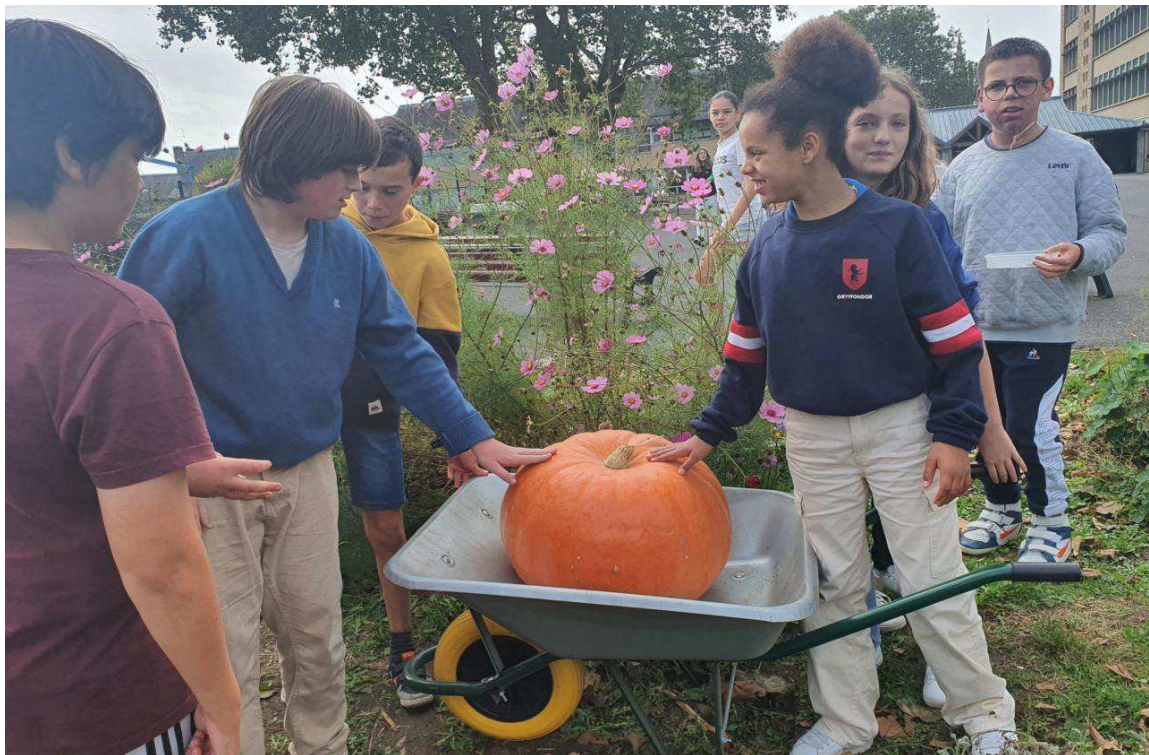
La récolte de la citrouille géante du jardin du collège Jules-Verne a marqué les élèves.