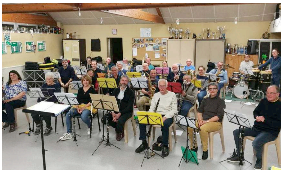
→ L'harmonie, lors d'une répétition au mois de mars dernier.

Amis musiciens de tous niveaux, dont l'instrument ne sort que trop rarement de son étui, vous êtes invités à venir rejoindre les rangs de l'harmonie tous les mardis soir. Le meilleur accueil vous sera réservé quel que soit votre niveau musical. L'harmonie recherche en particulier des clarinettes,