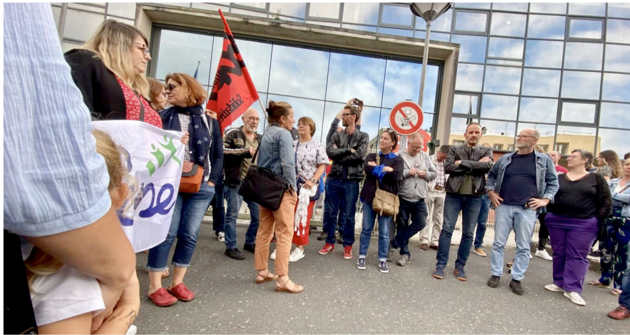
→ Une quarantaine de professeurs et de parents d'élèves étaient présents devant le lycée pour clamer leur mécontentement.