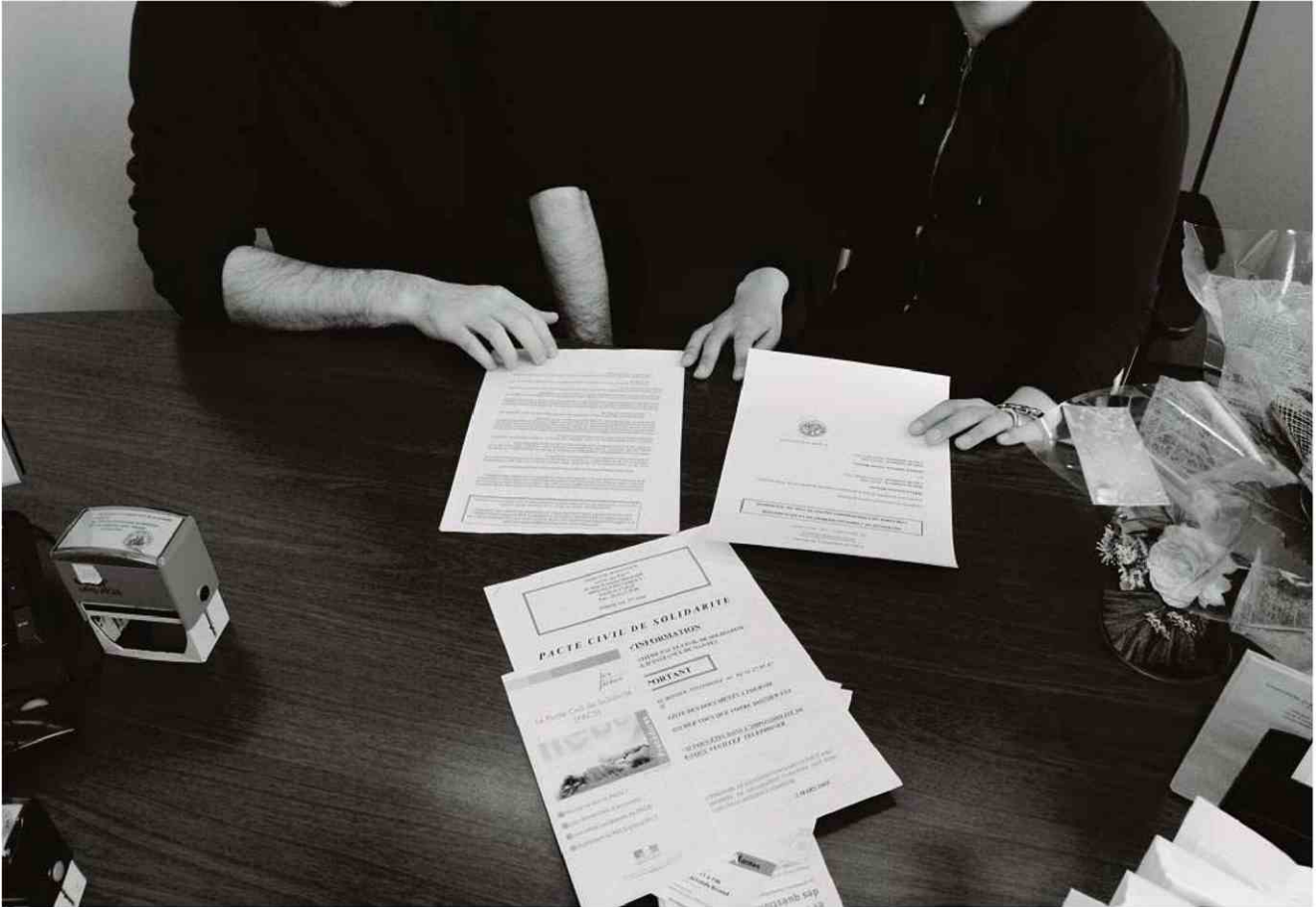
En 2019, un tiers des demandes de mutation interacadémiques étaient faites pour se rapprocher d'un conjoint, que ce soit un vrai ou un faux.