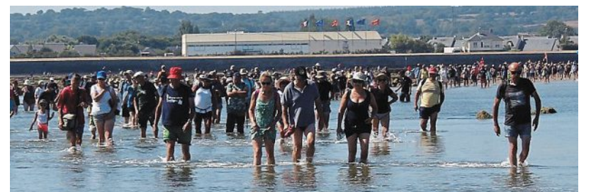
Les premiers festivaliers ont traversé l'estran, l'eau au genou, afin d'avoir les meilleures places sous le chapiteau de l'île Tatihou.

Le festival a commencé mercredi. Les premiers spectateurs ont dû traverser l'estran pour profiter des concerts.