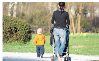
Depuis la loi du 24 août 2021, appelée loi séparatisme, l'instruction en famille a été davantage restreinte.

À partir de la rentrée 2024, tous les enfants seront concernés. Les familles peuvent invoquer quatre motifs : l'état de santé de l'enfant ou son handicap, la pratique d'activités sportives ou artistiques intensives, l'itinérance de la famille en France ou