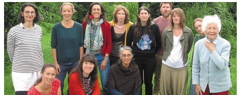
Quelques-uns des membres du collectif Instruction en famille.

Le collectif est notamment préoccupé par le problème de harcèlement scolaire : « C'est un sujet qui fait la une et les établissements, les élus et la population s'unissent pour y remédier. Pour la victime ou pour le coupable, la solution souvent évoquée est le changement d'établissement. » À leurs yeux, l'autre solution peut être l'IEF : « Malheureusement, nous observons qu'elle semble menacée de disparition alors que la loi autorise cette pratique. Par