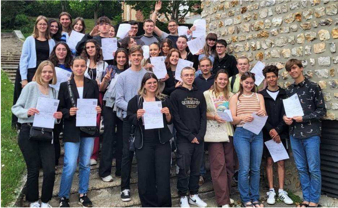
Un premier groupe de lycéens de Fresnel admis au premier tour du baccalauréat.