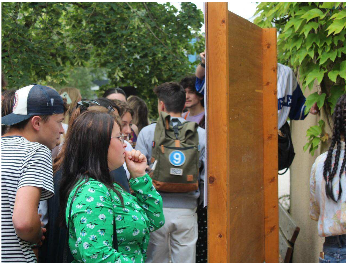
Mon nom est-il sur la liste...

Une élève qui a eu son bac professionnel de gestion d'administration déclare que les matières générales ne l'ont pas aidée. « J'ai complètement raté mon épreuve de mathématiques, mais, heureusement, je me suis rattrapée sur les matières professionnelles avec un coefficient bien plus important ».