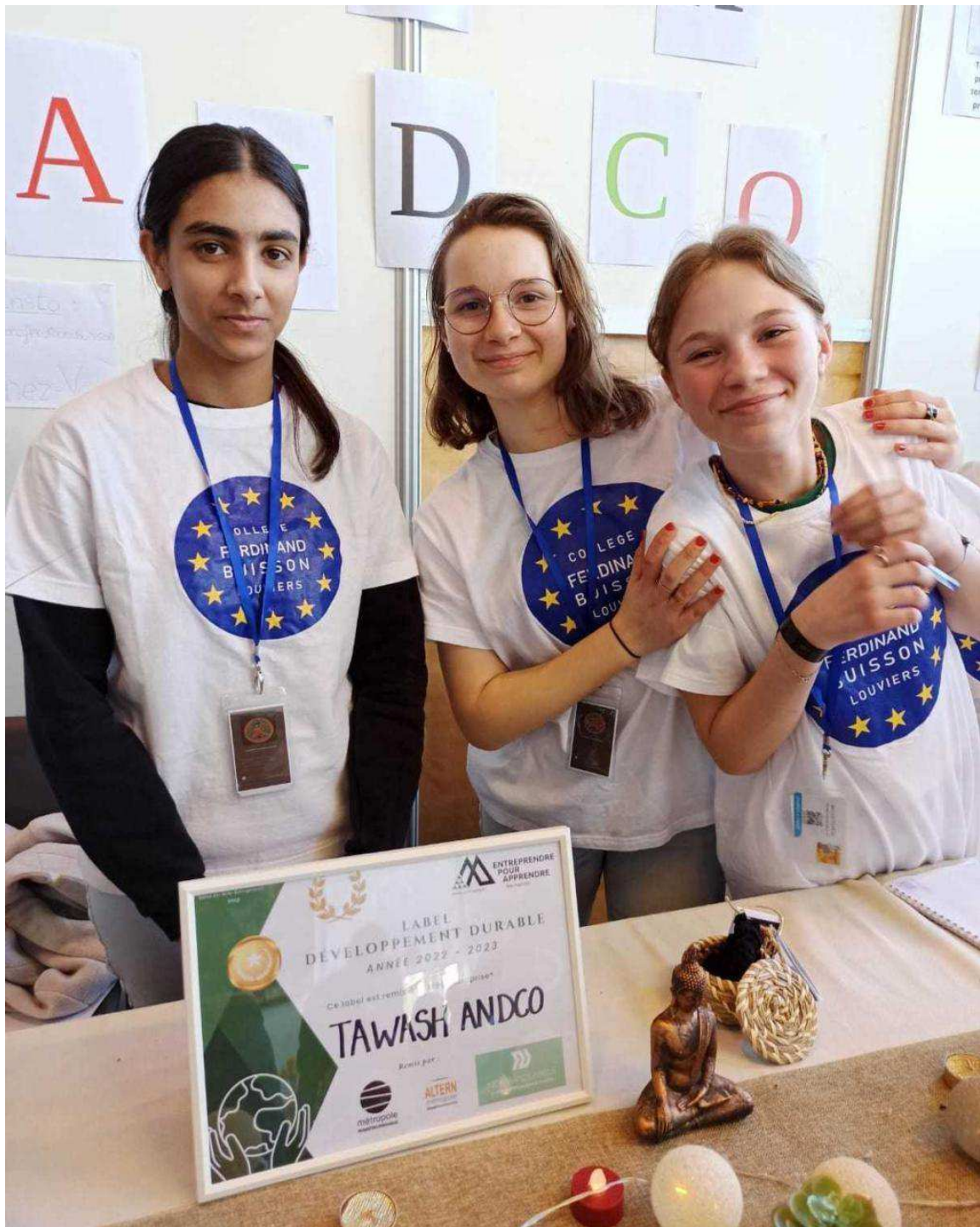
Tawash and Co et son label "Développement Durable".