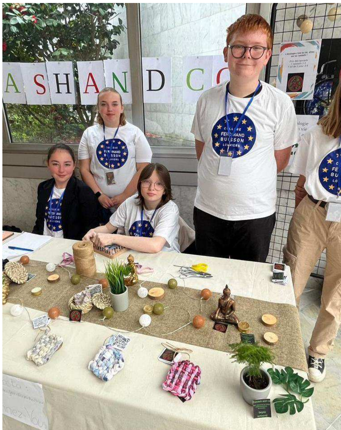
Tawash and Co lors du festival des mini-entreprises de l'Eure, le 5 mai. Photo envoyée par Cyrille Lendormy

Les créateurs de Tawash and Co durant le festival des mini-entreprises de la Région, le 30 mars dernier. Photo envoyée par Cyrille Lendormy