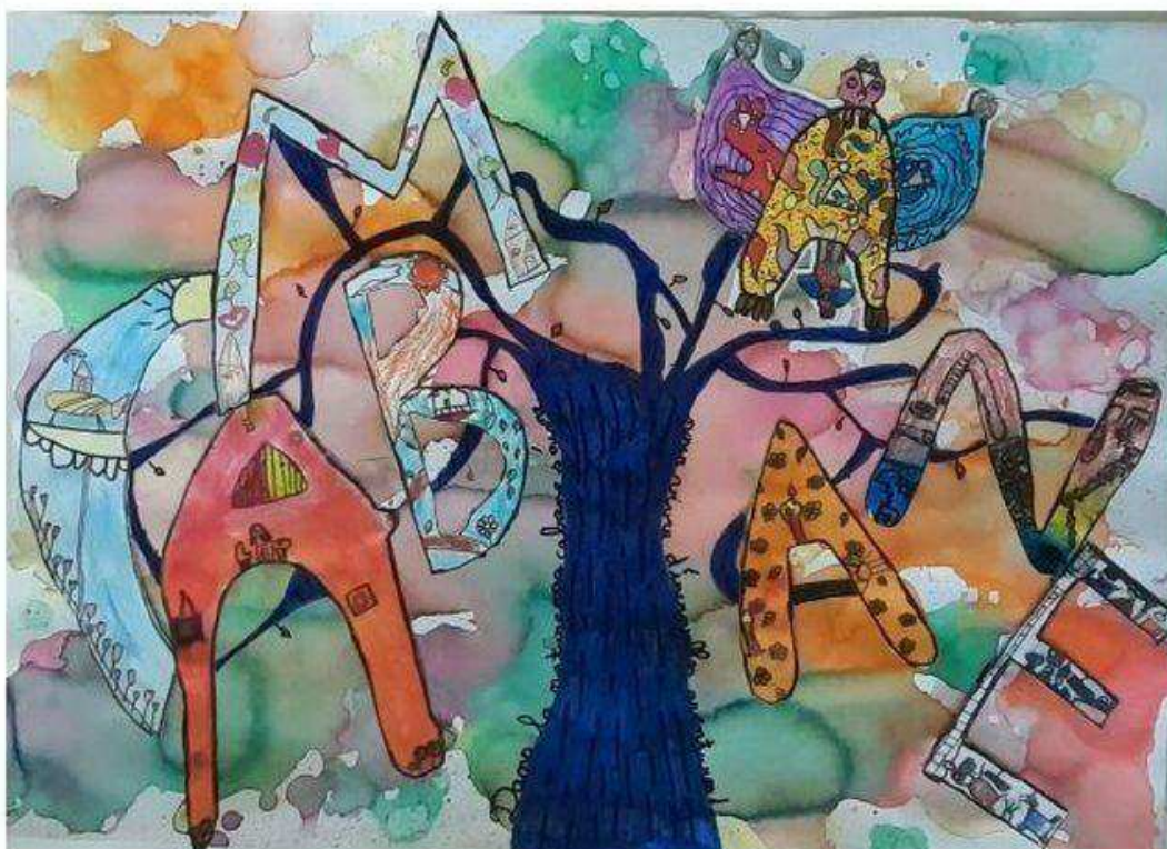
L'affiche de la Classe de Madame Bourienne École de La Barre

Des lots de livres, dont certains dédiés, ont été remis aux classes lauréates. Les affiches sélectionnées seront exposées à la librairie « L'Oiseau lire » à Évreux , puis restituées aux écoles.