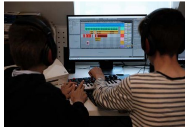
Les adolescents en pleine production.