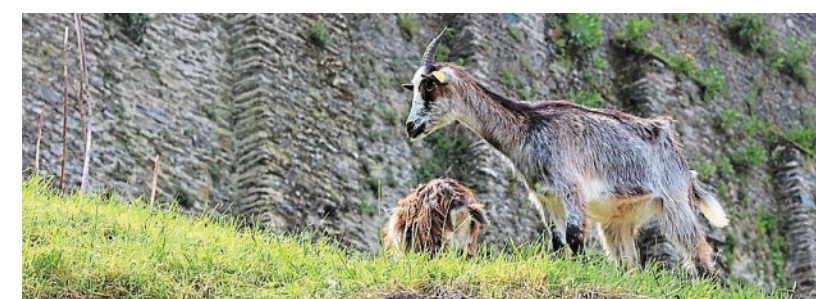
Des chèvres pour nettoyer les abords des remparts, rues des Noyers et de La Poterne.