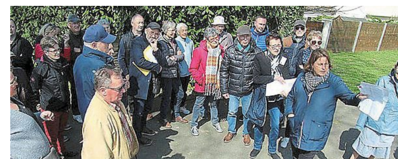
Les élus de Saint-Lô avaient rencontré les habitants du quartier de l'Aurore, le samedi 8 avril.