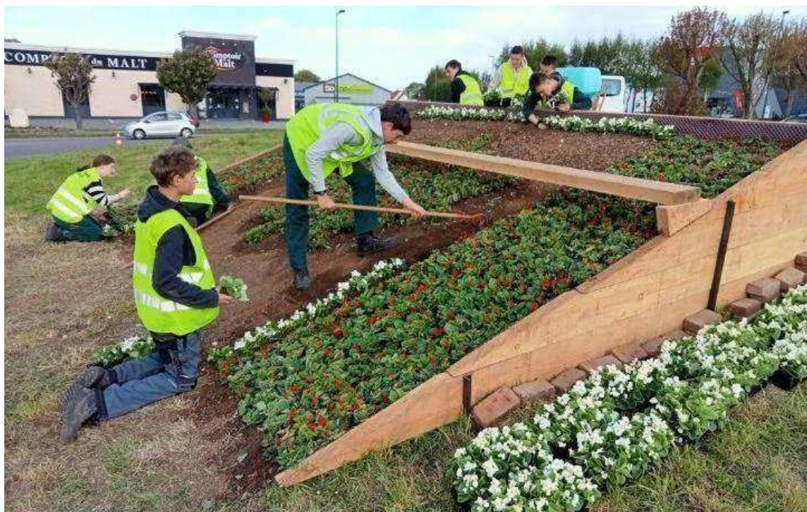
Les élèves sont intervenus sur le rond-point début mai.