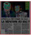
Image non disponible. Restriction de l'éditeur

POUR PAP NDIAYE, il "n'est pas souhaitable" d'avoir des conseils de classe trop tôt, au risque de voir les élèves désertier les établissements bien avant la fin officielle de l'année scolaire. Une commission nommée en janvier a été chargée de réfléchir au calendrier scolaire national. Ci-contre, avec Jean-Michel Blanquer, en mai 2022.