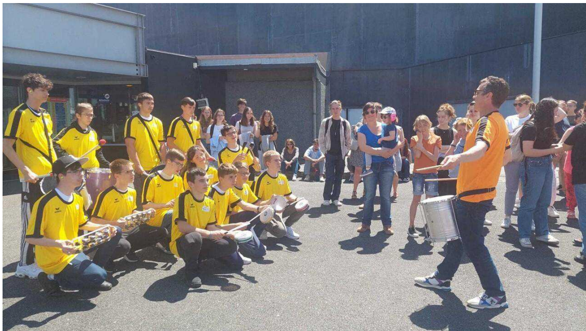
13 élèves de Mezen se sont essayés à la Batucada.

Une esplanade occupée par plusieurs stands et activités, dont celle proposée par le lycée Mezen, avec un numéro de batucada brésilienne.