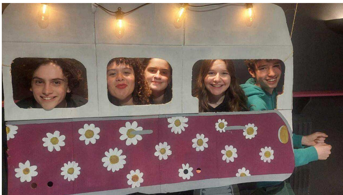
Les cinq lycéens à l'origine de l'organisation de cette 6e édition du Festi-Bahuts.

Ouvert gratuitement au public, le festival Festi'bahuts était organisé par cinq élèves de première option musique au lycée Marguerite-de-Navarre, dont les quatre