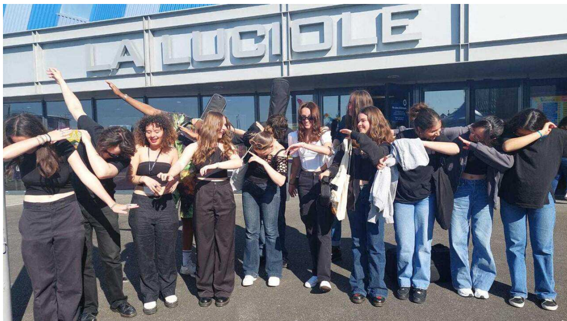
Les trois troupes musicales réunies devant la Luciole pour la photo finale.

Si les trois groupes ont remporté des répétitions dans les locaux de La Luciole, Elise et ses camarades ont obtenu, en plus, le droit de jouer lors d'un showcase, à la fin de l'été, à la médiathèque Aveline.