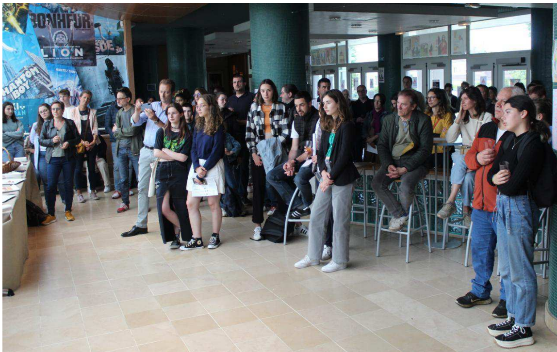
Les élèves ont été félicités pour la pertinence et la qualité de leur travail. CM